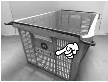
▲スプレー缶専用カゴ

資源ごみ収集活動において、小型金属類の中に、スプレー缶の混入がありました。処理において引火に繋がる恐れがあり、非常に危険ですので、「スプレー缶およびカセット式ガスボンベ」は、スプレー缶専用カゴに排出し、小型金属類に混ぜて排出しないよう、分別のご協力をお願いいたします。また、スプレー缶およびカセット式ガスボンベは、中身を完全に使い切った状態で、穴をあけずに排出をしてください。缶の素材で分別する必要はありません。