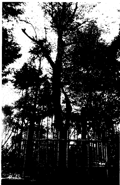
図4-33 天然記念樹「マメナシ」

なお、この「小口神社」は、古書延喜式神名帳に記され式内社として後世に伝えられ、また、尾張本國帳には「從三位小口天神」と記され、町内で現