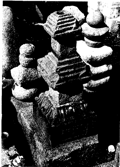
図4-36 織田遠江守広近の墓碑(中小口妙徳寺)

また中嶋氏については、当町余野神社宝物「青銅鐙口」の寄進(慶長二年・西暦一五九七)からもこの地とは、格別 深い関係にあったと考えられる。