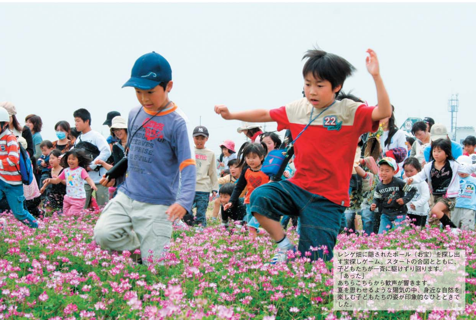
レンゲ畑に隠されたボール（お宝）を探し出す宝探しゲーム。スタートの合図とともに、子どもたちが一斉に駆けずり回ります。「あった」あちらこちらから歓声が響きます。夏を思わせるような陽気の中、身近な自然を楽しむ子どもたちの姿が印象的なひとときでした。