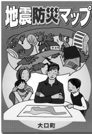
各世帯に配布された地震防災マップ。住んでいる地域の危険度を知ることが対策の第一歩。家族で避難場所も確認しておこう。

建築後の年数、塀の高さ・厚さなどの基本性能のほか、塀の状態、補強の有無などを入力すれば、点数で安全性が判断できる。