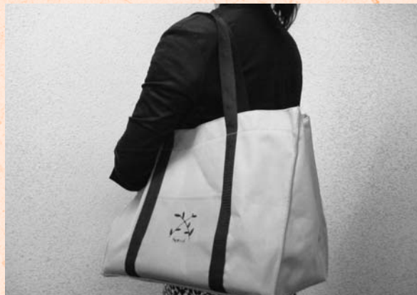
お買い物以外にも重宝しそうなエコバッグ