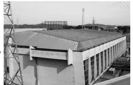
今年の年末にはリニューアルされる中学校体育館。