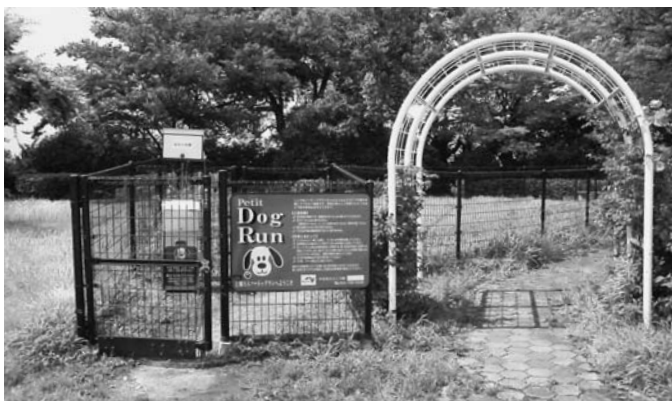
東名高速道路上郷SA（上り線）にも

大口町は、散歩させる場所にも苦労する大都市とは違う。現在のところドッグランの整備は考えていないので、こうした施設を紹介したい。