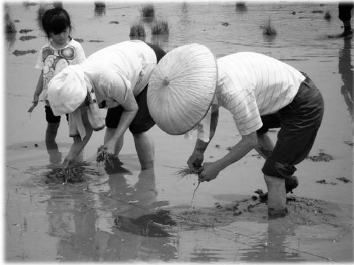
“黒米オーナーになりませんか”呼びかけに応募された皆さんが、黒米の田植えを体験。