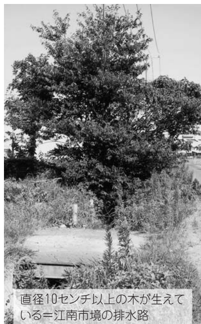
直径10センチ以上の木が生えて いる＝江南市境の排水路

4300トンの雨水貯留 施設を建設した。今年度 は余野地区に1000ト ンの調整池を造る。進行 中の事業の効果、大口町 全体の計画を見ながら、 総合的に検討したい。