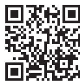
一般質問動画 QRコード(大竹)