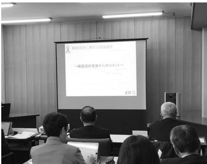
この勉強会では、さっそくタブレットを活用しました