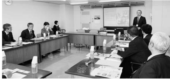
小学校教諭でもある指導主事による説明

鳥栖市は佐賀県の東部に位置し、福岡県に隣接した人口約7万3千人のまちです。市内には製菓、住宅、食品など優良な企業が多く立地し、佐賀県内でも唯一、人口増加が毎年見込まれています。