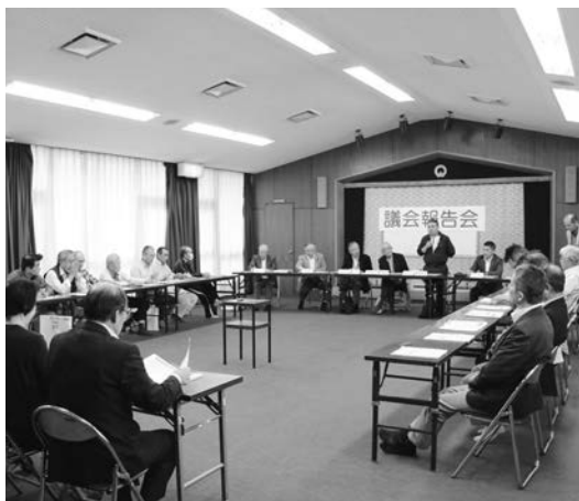
総務建設常任委員会の議会報告会の様子

日時 10月20日(土) 午後1時30分～3時15分 会場 河北学習等供用施設 参加人数 22人 テーマ 空き家対策、コミュニティバス、交通安全対策