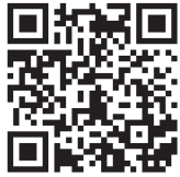
一般質問動画QRコード(柘植)