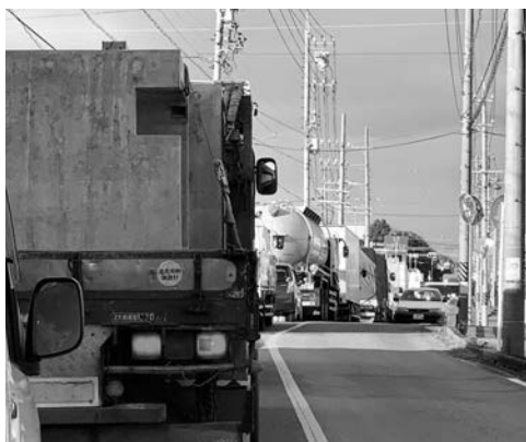
国道41号を東西に横断する道路の様子 (中小口3丁目交差点東側 平日午前9時頃)