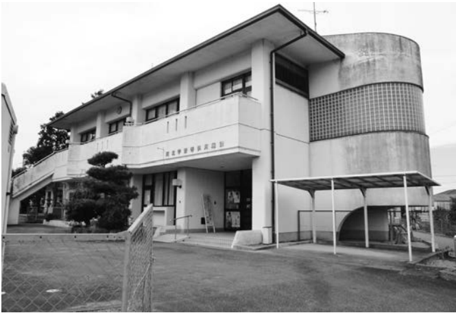
今年度、空調取替工事を行った河北学供

答 全ての学共等はアスベストの調査を行っており問題は無い。ただし、今回の空調の配管のように工事の際に中を開けてみないと分からない場合がある。配管の接続部分に使用されており、空調の吹き出しには関係ないため人体への影響はない。