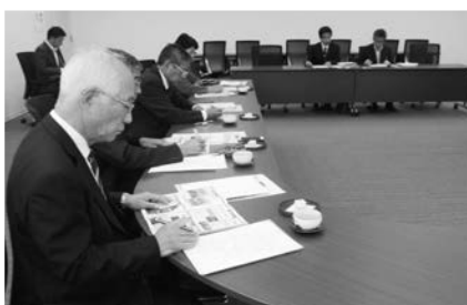
大変参考になる取り組みを勉強できました

このように、認知症になっても安心して暮らせるまちづくりに取り組まれる姿勢は、本町の認知症対策にも参考になるものと感じました。