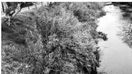
堤防の中腹より下側に雑草が繁茂(河北地内)

はきれいになっているが、県が行う部分で中途半端な刈り方である。特に右岸側をしっかり切るように要望していただきたい。