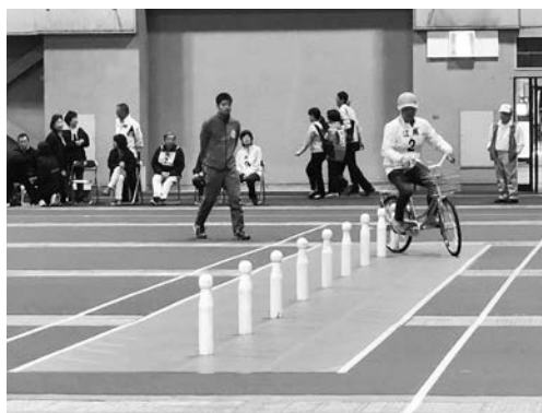
スラローム競技に挑む大口町チームの選手