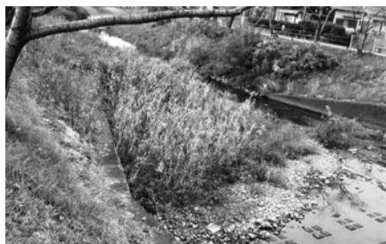
早期の浚渫が望まれる五条川(河北地内)

おいて、土砂の堆積状況が著しい流水阻害となっているかどうか、定期的に安全を確認し、必要に応じて浚渫してもらうよう、県に働きかけている。