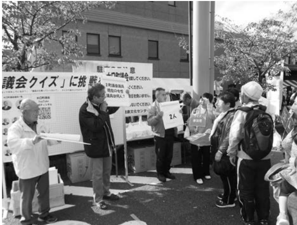
全問正解を目指して!!