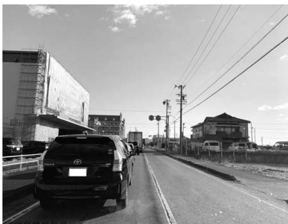
平日午前9時頃の町道大口桃花台線。国道41号に向かう車で渋滞しています

は計画されている。今後は、町道小口線の整備によつては、交通量の増加も考えられるが、まずは国道41号6車線化等の整備事業の効果を検証しながら検討していく。