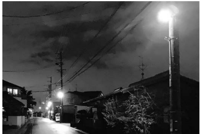
LED防犯灯が暗い夜道を明るく照らします

答 28年度、29年度に要望されたものが36基あり、今回の補正予算ですべて対応する。