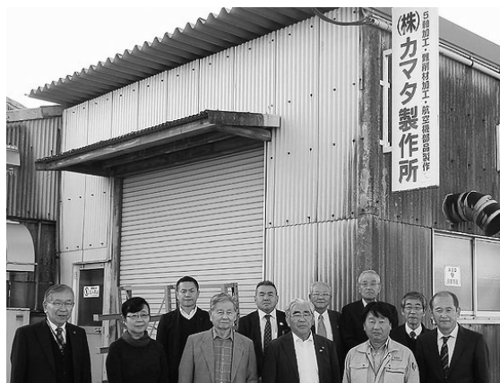
素晴らしい加工技術の一端を拝見させていただきました