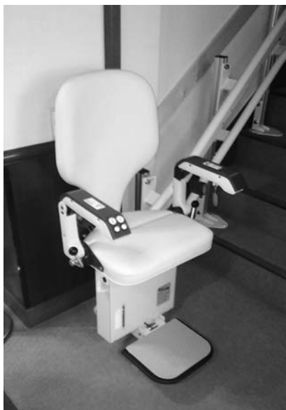
尾張北部聖苑に設置された階段昇降機。学共等にも何らかの対策を！

階段昇降機の設置について検討しているが、建築基準法によると、現在の階段の幅では設置が難しい。何か良い方法がないか、引き続き検討していきたい。