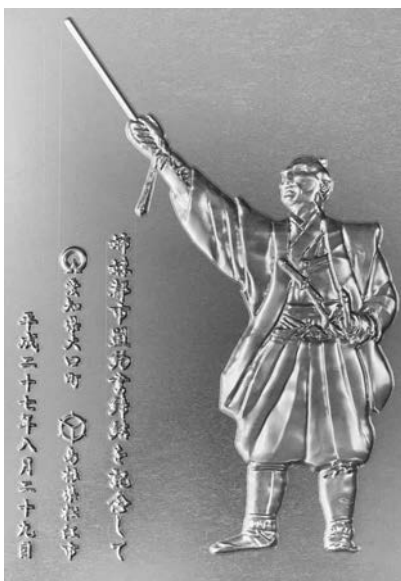
松江市に寄贈された堀尾吉晴公のアルミ削り出しプレートも手掛けられました