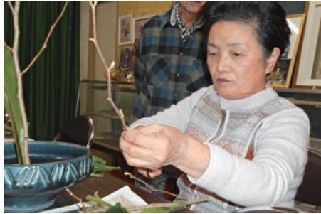
真剣なまなざしでお手本を見せる先生

昭和48年に始まった金助桜まつりのおり、豊田区公民館にて婦人会員として、いけ花展示と抹茶を振舞うことになりました。その後、昭和54年に豊田学共ができた際に、茶華道クラブを発足させました。