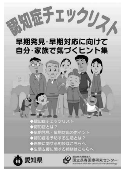
当日配布した資料の一部。愛知県が発行している認知症チェックリスト

主要道路については道路パトロール時にセンターライン、路面標示を点検し、消えている箇所の引き直しを計画します。信号機の時間変更については、その他の信号機への影響が広範囲に及ぶため難しいです。