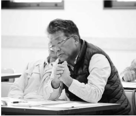
参加者の皆さんから様々なご意見をいただきました