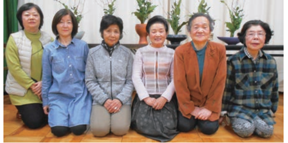
私たちと一緒に活動してみませんか!!