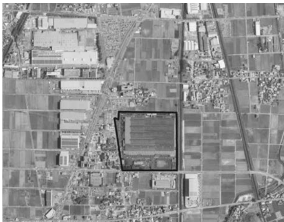
建築物の種類が制限される新宮地区の一部(枠内)