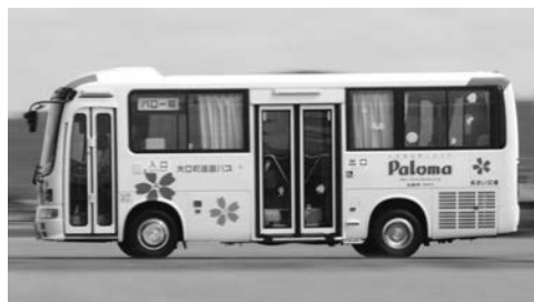
ダイヤの充実が求められるコミュニティバス