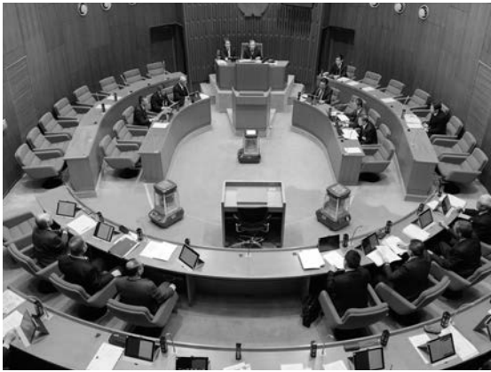
定例会最終日の本会議の様子。各議員の席にはタブレットが並んでいます

今回の定例会はタブレットを使用して初めての議会ということですが、心配する面もありませんが、