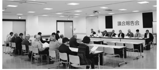
文教福祉常任委員会の議会報告会の様子

日 時 10月21日(日) 午前9時30分～11時40分 会 場 健康文化センター1階多目的室 参加人数 19人 テ ー マ 第1部 大口町の教育 第2部 認知症関係