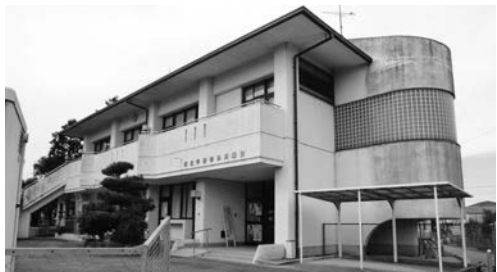
地域の避難所としての活用が求められています

各地域の学共等にまで拡大すると、職員の手が回らなくなる可能性があるため指定していない。