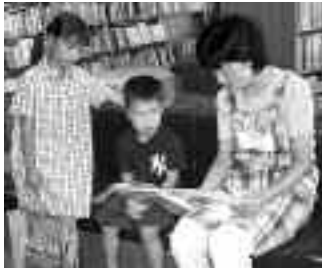
▲「おはなしエプロン」のようす

何かしたいけれど、ひとりでできるボランティアは無いかとお探しの方。短時間でできるボランティアをお探しの方、児童室で、絵本を読むのが好きな方。お気軽にお問い合わせください。