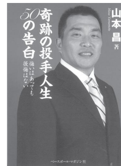
奇跡の投手人生 50の告白 山本 昌/著

中日ドラゴンズの背番号34をご存知ですか? 「挫折・敗北・失敗の連続が僕の野球人生だった。ただ、野球が好きだった」レジェンドと呼ばれ50歳で引退した山本昌投手が語る野球哲学やその生き方。