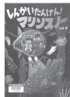
しんかいたんけん! マリンスノー 山本孝/作

125年前に日本人がエルトゥール号の乗員を救助したことにより、30年前空爆の続くイランからの日本人救出にトルコ航空は危険を冒して向かった。国が「国民」を守るとは? 4つの救出をめぐる物語。