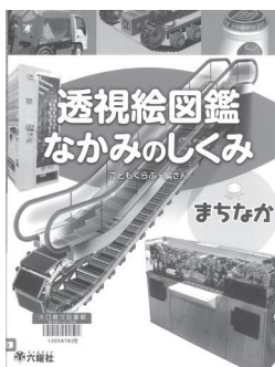
透視絵図鑑 なかみのしくみ こだもくらぶ/編纂

深海探査艇マリンスノーで探検に出発! どんどん潜っていくとどんどん暗くなってきた。あっ、シーラカンスがいるぞ! 大きなクジラの骨も発見! ふとんに入った兄弟の空想世界を描いた絵本。