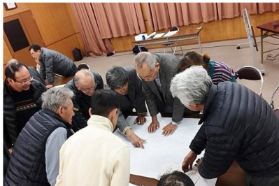
会議の様子 (下小口)