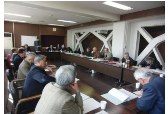
▲ 第1回設立準備委員会の様子