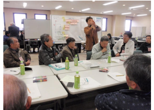
▲ 第1回座談会（交通安全部会の様子）

理事・まちづくり委員とで実施した第1回座談会（1月18日）では、今後取り組む事業のアイデア出しをしました。“できること”“身近なこと”から実施し、少しずつ活動を広げられるよう組織づくりをしていきます。