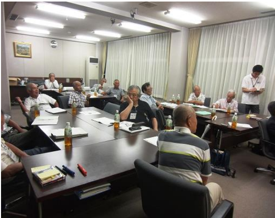
▲設立準備委員会の様子