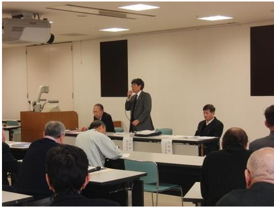
北地域の活動状況を説明しました。

平成25年2月7日（木曜日）、大口町健康文化センター多目的室において、地域自治組織の設立を目指して活動している各地域（南、北、中）のまちづくり協力員や設立準備委員が一堂に会して、第2回3地域交流会を開催し、私たち北地域からも準備委員全員（15名）が参加しました。この交流会は、それぞれの取り組みの「いいとこどりをしよう」という発想から生まれ、他地域