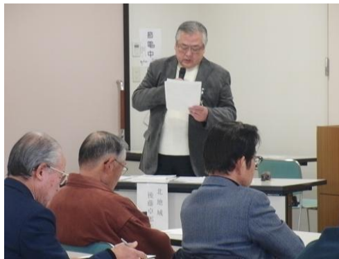
意見交換タイムで進行を務めました。

平成25年2月7日（木曜日）、大口町健康文化センター多目的室において、地域自治組織の設立を目指して活動している各地域（南、北、中）のまちづくり協力員や設立準備委員が一堂に会して、第2回3地域交流会を開催し、私たち北地域からも準備委員全員（15名）が参加しました。この交流会は、それぞれの取り組みの「いいとこどりをしよう」という発想から生まれ、他地域