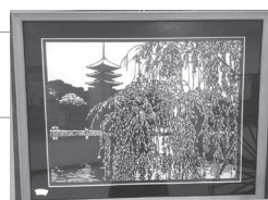
中央公民館1階に作品展示中