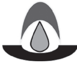
愛知県での特定都市河川浸水被害対策法に関する取り組みのシンボルマーク

このシンボルマークは、雨のしずくを受け、水を貯め、緑をはぐくむことをイメージしたものです。