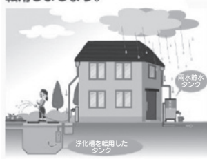
※1つの浄化槽で約1000リットルの雨水を貯めることができ、新川流域で今後10年間下水道へ接続する家庭で浄化槽を雨水貯留浸透施設へ転用すると、約5万㎡の雨水を貯留することができます。