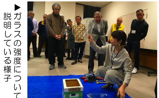
▶ ガラスの強度について 説明している様子