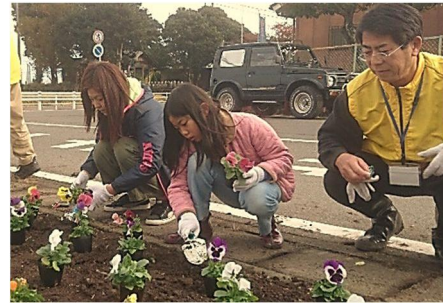
◀ 仲沖地区 ふれあい花壇