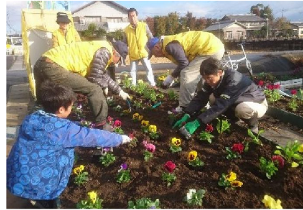
◀ 新宮地区 ふれあい花壇