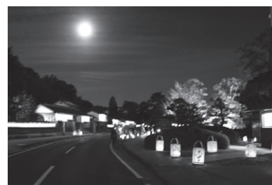
▲塩見縄手に並べられた行灯