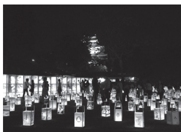
▲松江城 二ノ丸のコンテスト会場