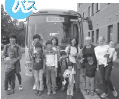
▲移動は通常ダイヤのコミュニティバスで、初めて乗る方も！