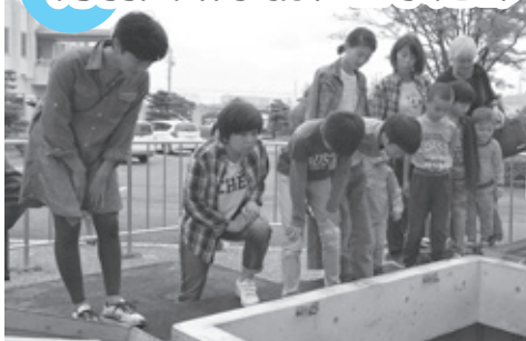
▲水道についてクイズを交えながらお話を聞いた後、施設内の見学をしました。