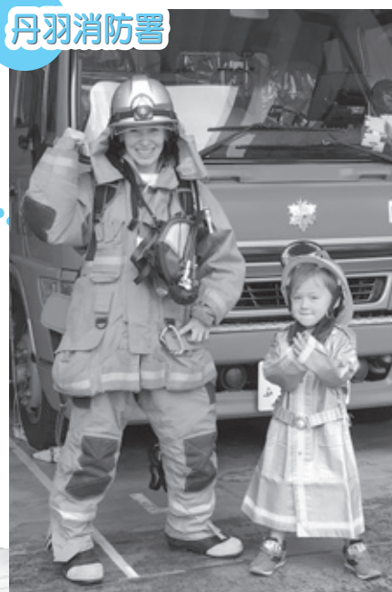
▲救急車での出動、消防車での放水、防火服を着て記念撮影をしました。