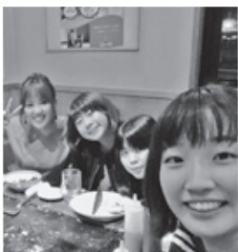
▲お好み焼き屋にて中学時代の同級生の結婚祝

家族全員スポーツ好き。自分は小4から高3までバレーボールに打ち込みました。負けず嫌いで、コーチに挑発されるとますますやる気に。けがをしてポジションを取られそうになったときの悔しさは忘れられません。仕事が落ち着いたら、またバレーボールを再開したいと思っています。