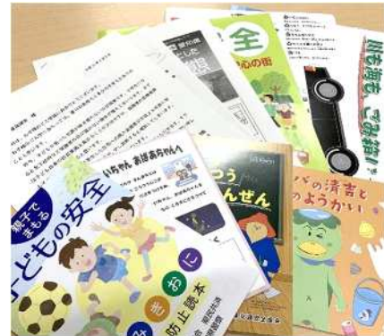
配布した啓発チラシ

4月5日（金）の小学校入学式に、新入学児童とその保護者の皆さんへ、防犯・交通安全を主とした啓発チラシ等を配付しました。児童の皆さんも外に出る機会が多くなります。この啓発チラシ等をご覧ください、家族そろって安全意識を高めていただくようお願いいたします。