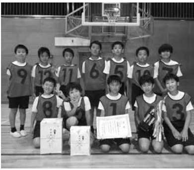
▲準優勝 大屋敷レッドウルフ