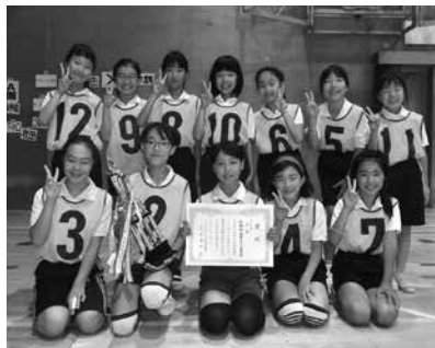
▲優勝 余野西・竹田チェリーブロッサム