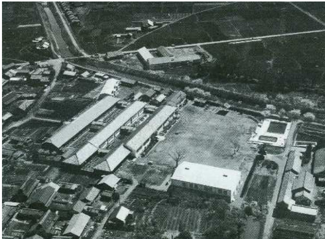
航空写真 昭和30年代後半