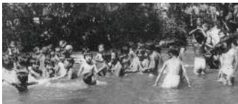
五条川の天然プール 昭和13年(1938)

明治22年(1889) 小口尋常小学校が小口神社境内に開校 明治40年(1907) 大口第二尋常高等小学校 創立 昭和16年(1941) 大口村北国民学校に改称 昭和22年(1947) 大口村立大口北小学校に改称 昭和37年(1962) 町制施行に伴い、大口町立大口北小学校に改称