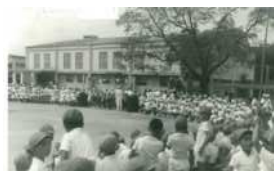
運動会の様子 昭和40年代