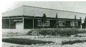
大口第二尋常高等小学校 校舎 昭和3年(1928)