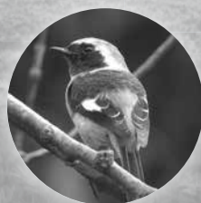
ジョウビタキ (秋～冬)