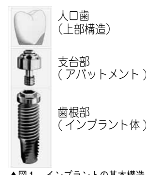
▲図1 インプラントの基本構造

基本的には3つのパーツからできています(図1)。顎骨の中に埋め込まれる部分すなわち歯根部(インプラント体)、インプ