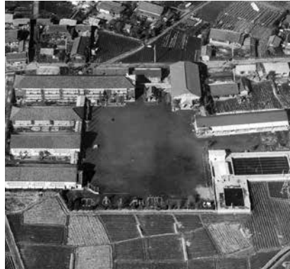
▲南小学校 航空写真(昭和40年頃)

部は強くて管内大会13連覇を果たした。3年生のとき南小学校のプールで練習したが水深が浅くて飛び込むときに気を使ったこと、北小学校のプールで練習するときには五条川から水と一緒に藻が入ってくるので、練習前に藻を取ったとのことでした。