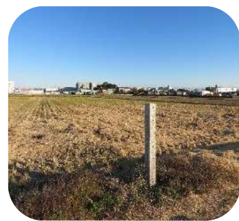
「いわき塚古墳の標柱（標柱左奥の森は神福神社古墳）」

国道155号線沿いを江南市の方向へ進み、五条川を渡る手前の南側一体は、田畑が広がっています。その田園風景の一角に、細い標柱が建っています。その場所には昔、いわき塚古墳という古墳時代のお墓がありました。いわき塚古墳は、昭和の初め頃、土取り作業によって破壊されたため、形や規模について詳しくはわかりません。しかし、その時出てきた遺物（古墳に納められたもの）から、今から約1,450年前に古墳が造られたと言われています。