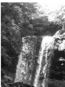
▲ドローンで撮影した滝

近年では、小学生がやりたい職業ランキングの上位に、ゲームクリエイターやyoutuberというカテゴリが常駐するようになりました。これからも、ゲームのプレイヤーとして、そして関わる業界の一人としても、今後の動向を見ていければと思っています。