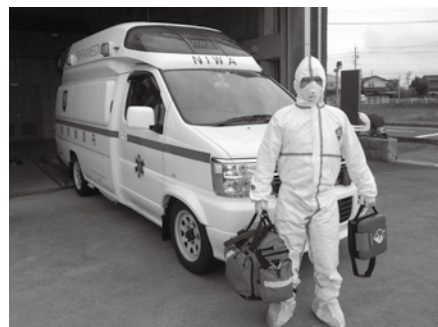
▲感染防護服装着後

※救急隊が防護服を着用しているからといって、傷病者が新型コロナウイルス感染症に必ずしも感染しているわけではありません。 ※出動後は、救急隊員および救急車内の消毒を十分におこないますのでご安心ください。