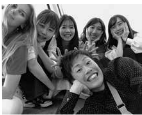
▲ロンドンのスカイタワーにて友だちと。2週間だけの語学研修でしたが、とても充実したものになりました。

将来の夢はフライトアテンダントになり、デンマークの永住権を獲得することです。海外の航空会社に就職することで、日本に縛られない、そんな生活をしてみたいと夢見ています。また、デンマークは社会福祉がしっかりしており、年金指数も世界第一位と、とても魅力的。外国人である私も、受給年齢直近の5年間を含む10年以上の居住期間があれば年金を貰える制度となっています。老後を考えた、安定した生活を送りたいです。