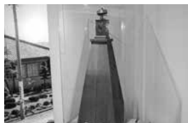
▲やぐら時計 江戸時代

資料館にはこれまで紹介した資 料以外にも貴重なものや珍しいも のがまだまだたくさん展示してあ ります。