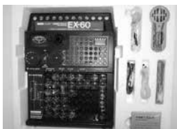
▲電子ブロックEX シリーズ 昭和50年代

※冬の企画展恒例の「お雛さ まやお内裏さまになって写 真を撮ろう」のイベントは 新型コロナウイルス感染症 拡大防止のため本年度は実 施しません。