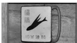
▲大口中学校水泳部管内大会 10連覇記念品 昭和31年