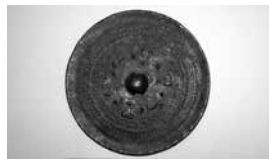
▲銅鏡 (四神二獣鏡) 古墳時代 石亀塚古墳出土