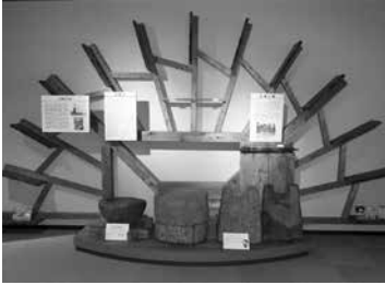
▲水車の羽根の模型

水車というところの大口町の姿からは想像もつきませんが、かつては五条川沿いにいくつもありました。江戸時代後期に始まり、多い時には9基の水車がまわっていたそうです。直径が7mから10mと、とても大きい水車でした。おもに米や麦をつくるに使われていたようです。水車のある家からは、朝早くから水車のまわる音やうすをつく音が聞こえ、村の風物詩とされていました。しかし電気や石油発動機などの他の動力が使われるようになり、水車もだんだん姿を消しました。