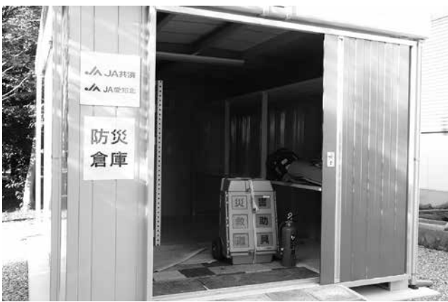
▲倉庫内は約6帖の広さ