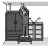
▲家具などの転倒防止策 (つっぱり棒やL字金具)

引っ越しなどで新居を構える方、部屋のかな模様替えをする方も多いのではないのでしょうか。この機会に、家具などの転倒防止策をしましょう。