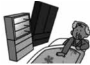
▲出入口・寝室では、家具の配置に注意！

いざという時、避難の妨げにならないよう家具の配置や方向にも注意が必要です。また、寝室では背の低い家具を置くか家具の置き方を工夫し、寝てい