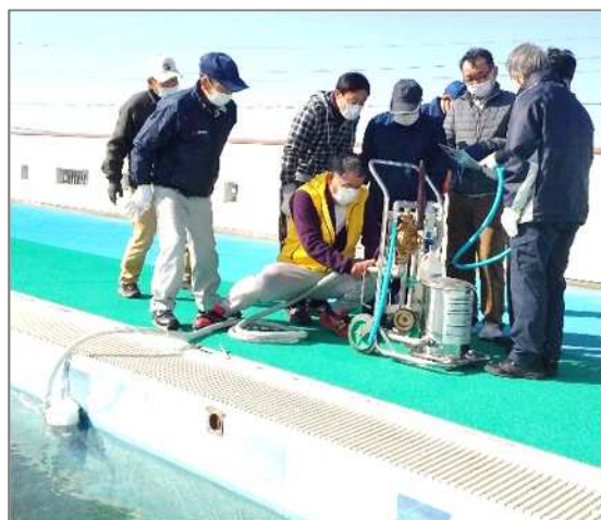
【北小プールでの浄水装置訓練の様子】