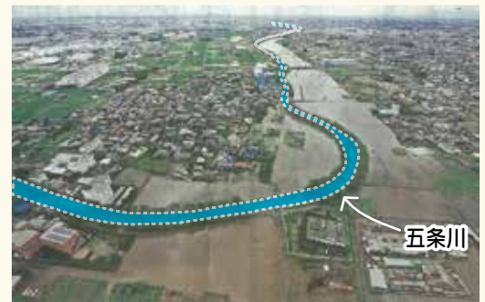
五条川の氾濫（豊田地区）