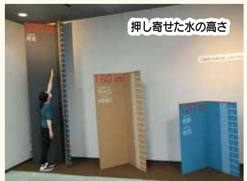
押し寄せた水の高さ