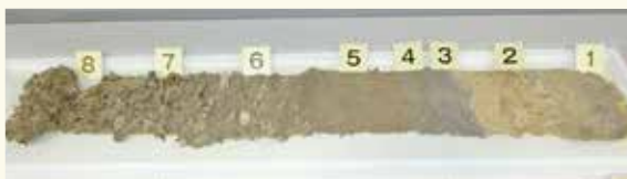
入鹿切れのあとが残る土や石の層 (6の層)

江戸時代から明治時代にかわるころ、毎日大雨が降り続き犬山市の入鹿池の堤防が切れ、流れ出た濁流が村々をおそったんだ。