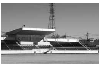
▲10月から 「オークマグラウンド」に