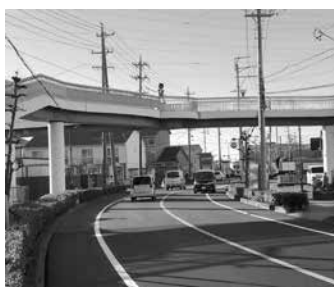
▲10月から 「オークマであい橋」に