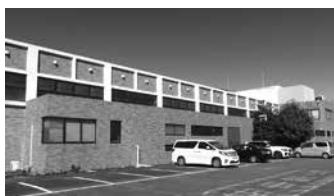
▲10月から 「オークマ温水プール」に