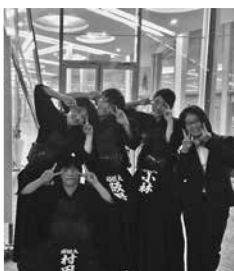
▲昨年度、全日本学生 剣道オープン大会にて

コロナ禍で学校に行けな かった半年間に料理にめざめ ました。クックパッドやユー チューブを見て食べたい料理 をいろいろ作っています。北 海道料理のザンギや台湾そば めしなど、凝ったものも作り ました。これからもおいしい 料理に挑戦したいです。