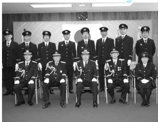
▲消防団 分団長(後列)