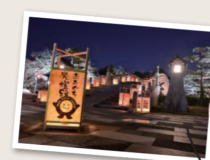
おおぐち光燈路 桜の開花時期に合わせて開催