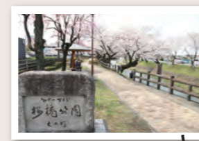
桜橋公園 川岸に下りられます