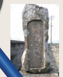
大口町南地域自治組織は 大口町プロモーションを 応援しています