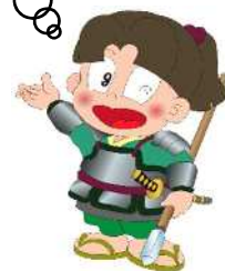
資料館キャラクター きんすけくん