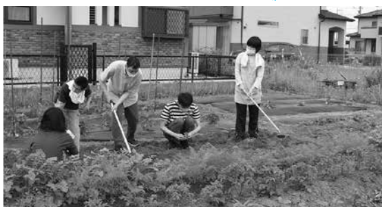
▲施設利用者と保護者が育てる夏野菜