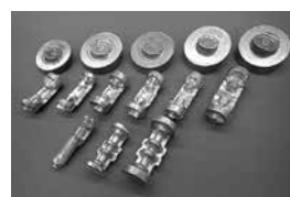
▲当社鍛造部品の一例

安全を全てに優先することをビジョンに掲げ、社員や家族の皆さんが、安心して長く働ける会社づくりに力を入れています。