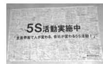
▲会社員の決意フラック