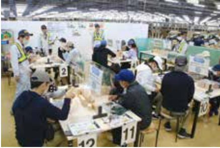
▲詰め合わせ体験コーナー