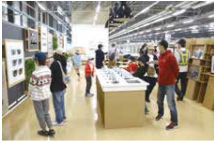
▲部品の展示コーナー

トヨタ自動車大口部品センターにて、大口部品センターの紹介をいただいたのち、センター内を間近で見学させていただきました。また、積み木を使った詰め合わせ体験では、どのように荷物を積み重ねない台数のトラックでの運送が可能なのかを考え、危険予知体験では、身近にある危険を予知することの重要性を学び、大口部品センターの環境と安全の取り組みを知ることができました。