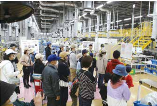
▲入荷した部品の重さ体験