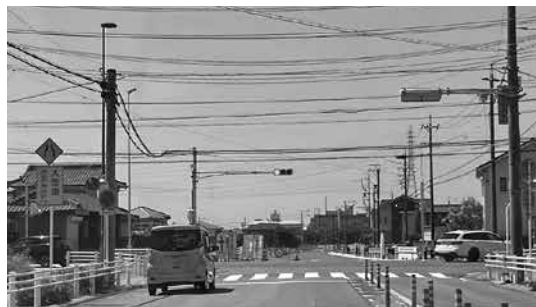
下小口三丁目交差点

なお、開通後は図のように交通規制が変わりますので、通行の際はご注意ください。ご理解ご協力をお願いします。