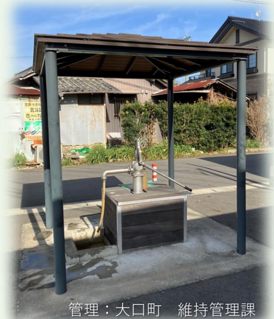
管理：大口町 維持管理課