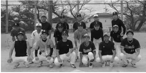
▲準優勝 下小口 下小口さんが積極的にスポーツに親しみ、地域の融和と親睦を図るとともに健康の維持と体力の増進を図ることを目的に実施されました。