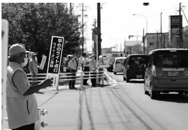
▲ハンドプレートを手に交通事故防止を呼びかけ