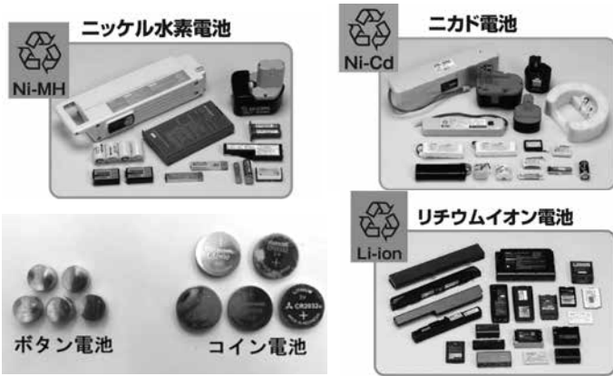
▲ニカド電池、リチウムイオン電池、ニッケル水素電池は必ず安全処置を施した状態で出してください。

抜き忘れがあると大きな事故につながる危険性がありますので、小型家電を出される際には、必ず電池を抜いてください。また、充電式バッテリーなどは、極力取り外していただくか、電力を使い切ってから出すよう、ご協力をお願いします。