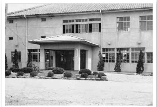
▲町制施行前の大口町役場

『大口町史～現代史編～』が令和6年3月に刊行する予定です。大口町史は、町ホームページで電子データを公開することにしてはいますが、冊子としてお手元に残したい方を対象に、事前予約を承ります。ご希望の方は町史編さん室までお電話もしくはメールでご連絡ください。