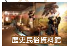
歴史民俗資料館 健康文化センター

憩いの四季 憩い処 さくら屋 水曜から土曜営業 午前9時~午後4時 (ランチ午前11時30分~ なくなり次第終了) ※金曜日はランチまでの営業