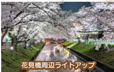
花見橋周辺ライトアップ

※雨天の場合 町民会館第一駐車場 出店するキッチンカーについては大口町ホームページをご覧ください。