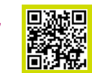
コミュニティバス時刻表

お花見は大口町コミュニティバスが便利です。 金助桜まつり会場の駐車場は限りがありますので、 ぜひ、コミュニティバスをご利用ください。