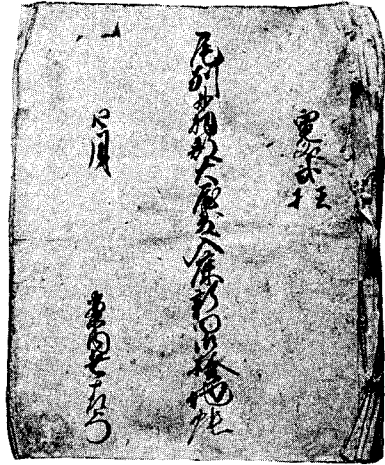
図2-66 検地帳(寛文二年)

これらは、この地方の検地とその後の新田開発の経緯を知る上に大きな参考となっている。