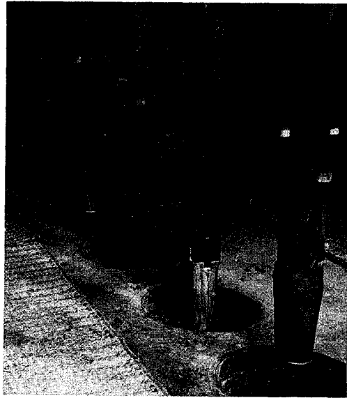
図 2-88 水 車

これが明治維新における徴兵制度の始まりであり、服役年限を四か年とし、年齢二十才以上三十才までの男子で、